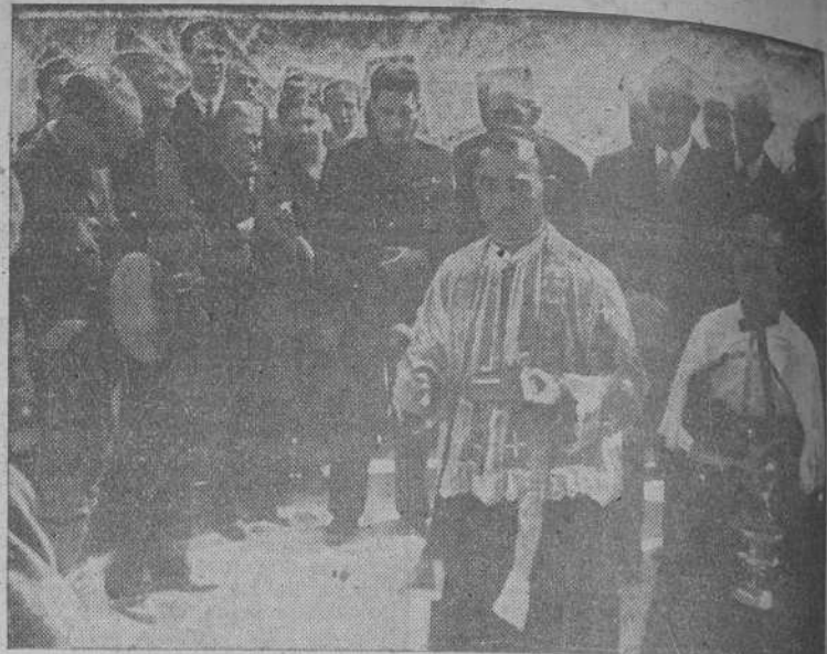
El M. I. Sr. Abad bendiciendo el edificio y dependencias de la nueva estación radio-costera

Conviene observar que la progresión que realizan las tropas alemanas que han ocupado Armavir, al otro lado del Kuban, amenaza llevar a la costa emboscada dentro de la bolsa así formada al centro petrolífero de Maikop, el puerto de Tuapse y la base naval de Novorossisk.