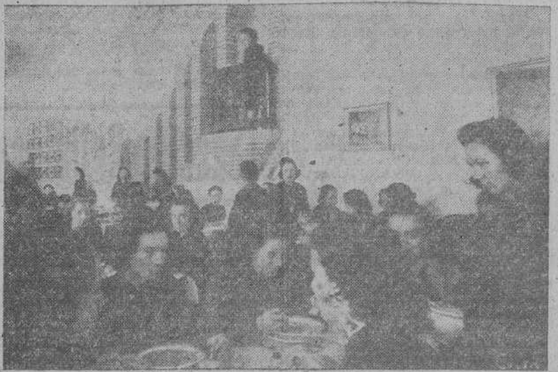
Detalle del comedor, en la Escuela de Mandos "José Antonio"

Si se reconociese en toda su magnitud el peligro que entraña la mordedura de un perro, no vacilaríamos en vacunarlo contra la rabia.