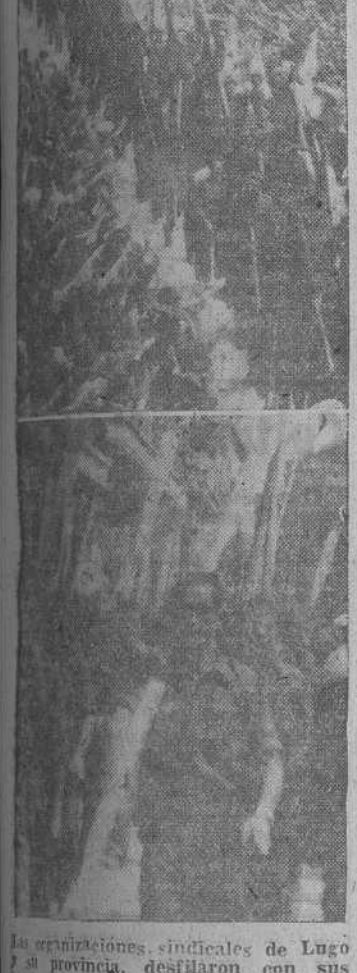
Las organizaciones sindicales de Lugo y su provincia, desfilaron con sus banderas y elementos de trabajo ante el Ministro Secretario del Partido.

Las calles, que desde la Basílica hasta la casa de la Falange había sido recorrida por la comitiva, estaban cubiertas por la Falange y se hallaban llenas por una enorme multitud.