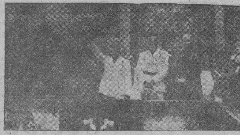
El Excmo. Sr. D. José Luis de Arrese corresponde a las aclamaciones de la multitud que ocupaba totalmente la Plaza de España, de la ciudad de Lugo.

La nota desahogada del desfile fueron los excoñabientes que pusieron de manifiesto su solidaridad y disciplina de recio espíritu falangista.