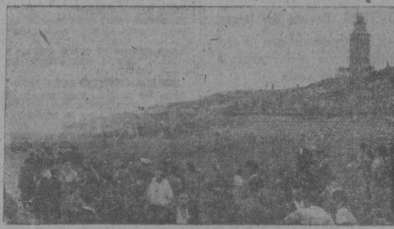
Lugar denominado "Monte Ato" donde estaba emplazado el polvorín que hizo explosión