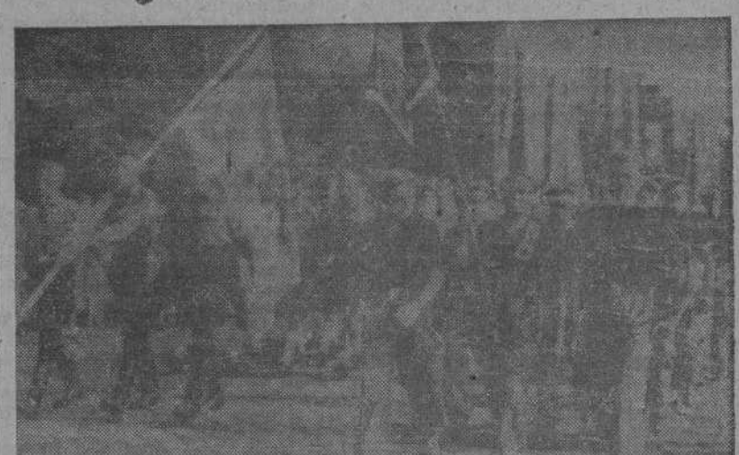
VIENA.—Camaradas del Frente de Juventudes de España desfilando en compañía de las demás representaciones que han asistido al Congreso de Juventudes europeas.