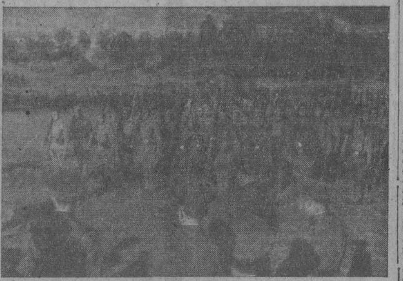
El capitán general de la Primera Región, general Saliquet, y el general Rada, jefe de la 13 División, en la visita que realizaron al Campamento de Milicias Universitarias, de la Granja.