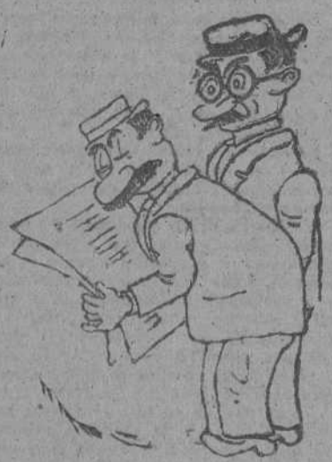
COMENTARIO: por Galindo. Leyendo los periódicos se aprende mucho. Sobre todo cuando le hablan a uno de Salomón.

VICHY, 29.—Según las últimas informaciones recibidas en el Secretariado de Colonias sobre la resistencia de las tropas francesas en Madagascar, la posición de Behenje es tenazmente defendida. Las tropas británicas están detenidas por numerosos obstáculos a 55 kilómetros de la capital.—(EFE).