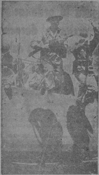
La infantería del aire americana salta del planeador, con la bayoneta calada y el fusil ametrallador dispuesto. Los aviones sin motor no descubren su presencia al enemigo. Claro es que el espectacular ejercicio se ejecuta en maniobras donde no hay más enemigo que el imaginario.