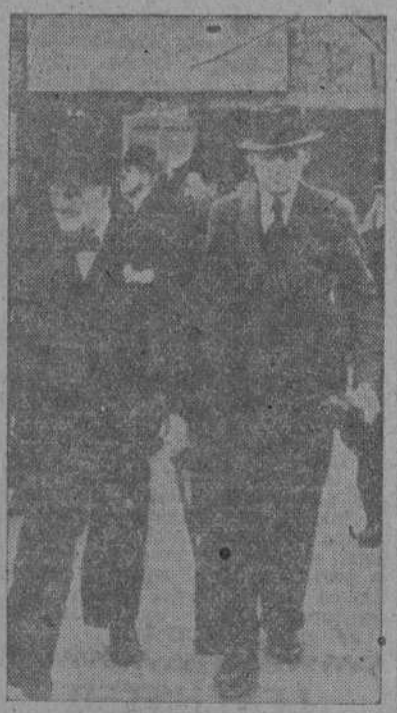
El fotógrafo ha sorprendido al Presidente del Consejo inglés en uno de los raros momentos en que no aparece con su inseparable puro. La fotografía fue tomada durante la visita del señor Churchill a una factoría de guerra en la que estaba prohibido fumar por el peligro de los explosivos.

Según Washington será iniciada cuando los preparativos estén ultimados para intentarla con éxito