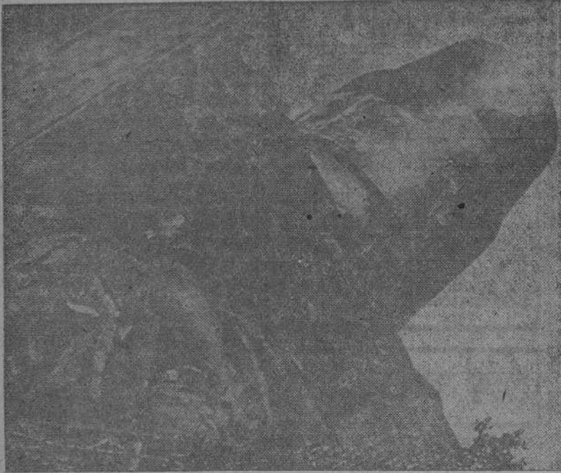
Mortero alemán "Thor" de 68 centímetros de calibre que se emplea actualmente en el asalto de Stalingrado

Después de una preparación minuciosa de artillería que ha durado cerca de una semana, las tropas de asalto alemanas—infantes y zapadores—provistas de lanzallamas y fuertemente apoyadas por morteros de grueso calibre, han lanzado un asalto en el barrio septentrional de Stalingrado, penetrando profundamente en las fortificaciones de la zona fabril metalúrgica, donde los rojos se defienden bajo los escombros.