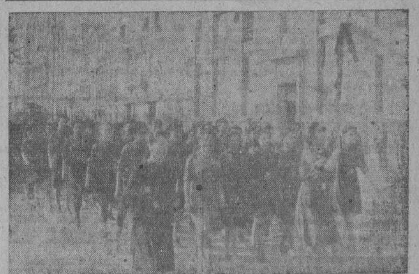
Las Flechas Azules de La Coruña que pasaron ayer a la Sección Femenina