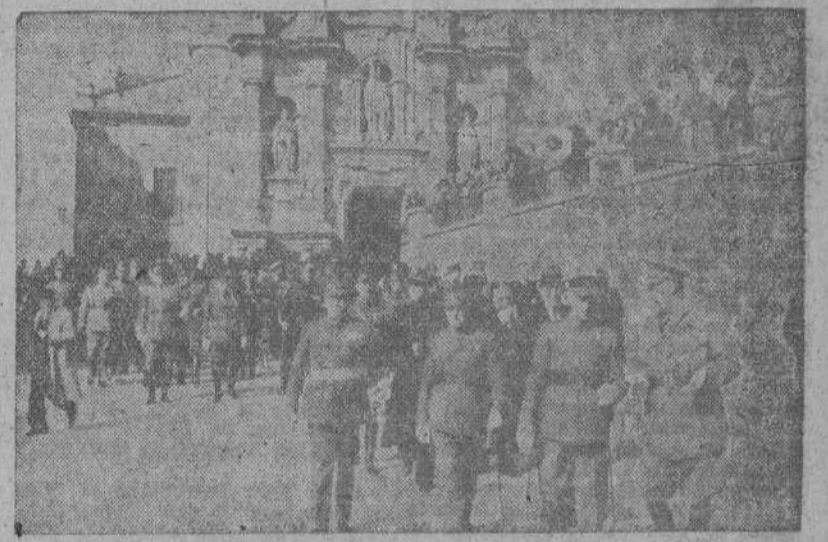
El capitán general al salir de la misa celebrada en San Jorge, con motivo de la festividad de Santa Teresa, Patrona de la Intendencia Militar

"Estaban justificados el ceño y la violencia cuando no existía otro camino para salvar a España, cuando estábamos en la brecha; pero, recobrada la nación, triunfante nuestro Movimiento, proclamada y en ejecución nuestra doctrina, la obra tiene que ser de amor y apostolado; intransigentes, si, en la defensa de nuestra verdad, pero amorosos en su predicación." (El Gaudillo)