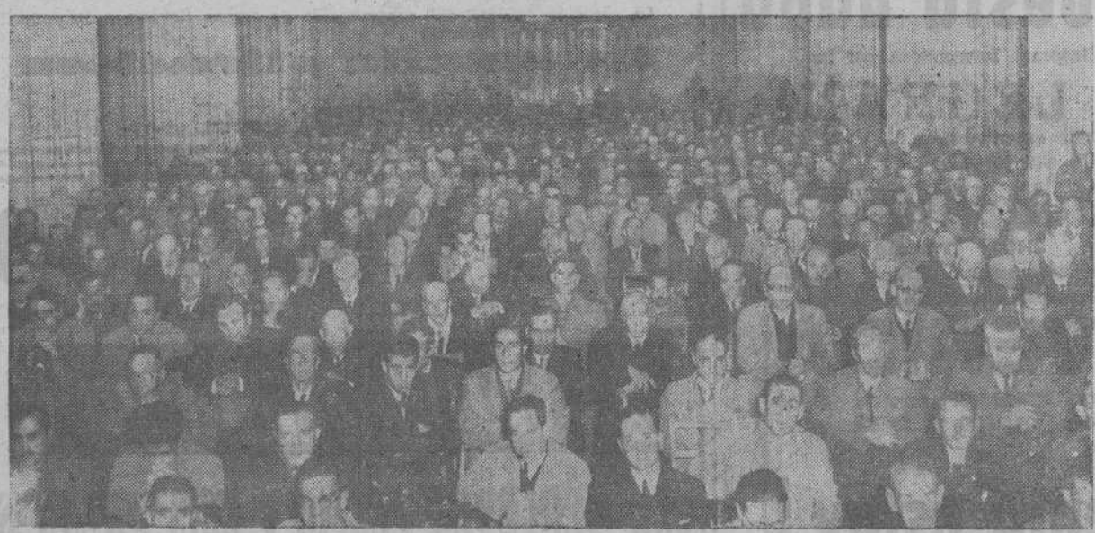
Aspecto de la Iglesia del Sagrado Corazón de Jesús de La Coruña, durante una de las jornadas de Ejercicios Espirituales para hombres. El templo está diariamente abarrotado de fieles ejercitantes que escuchan con el mayor recogimiento las saludables lecciones dadas por el P. Lamamié de Châtrac S. J.