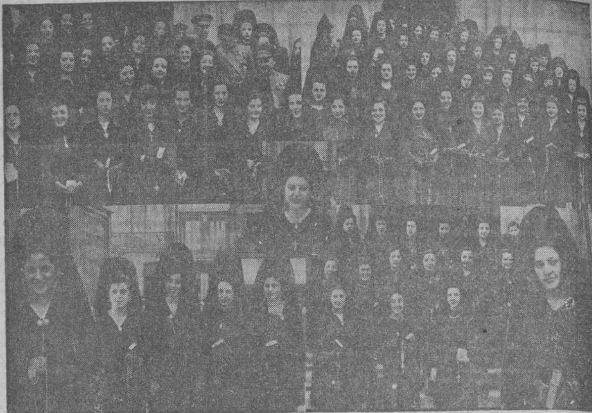
ALGUNAS DE LAS MUCHAS SENORITAS CORUNESAS QUE ASISTIERON A LOS SOLEMNES CULTOS DE JUEVES Y VIERNES SANTO LUCIENDO LA CLASICA MANTILLA ESPAÑOLA