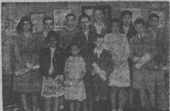
Premiados en la Exposición Infantil de la Asociación de Artistas

En la tarde de ayer se efectuó la clausura de la VI Exposición de Arte infantil, que con tanto éxito ha venido celebrándose estos días en la sala de la Asociación de Artistas, y el reparto de los premios que merecieron los pequeños artistas por su labor. Concurrieron, además de la Directiva de la Asociación, la directora de la Escuela Normal y profesores de distintos Centros docentes de nuestra ciudad. El gobernador civil no pudo concurrir, por tener que ausentarse, pero envió una cariñosa carta, que pidió fuese leída en este acto, testimoniando su pesar por no poder estar presente en tan simpática manifestación.