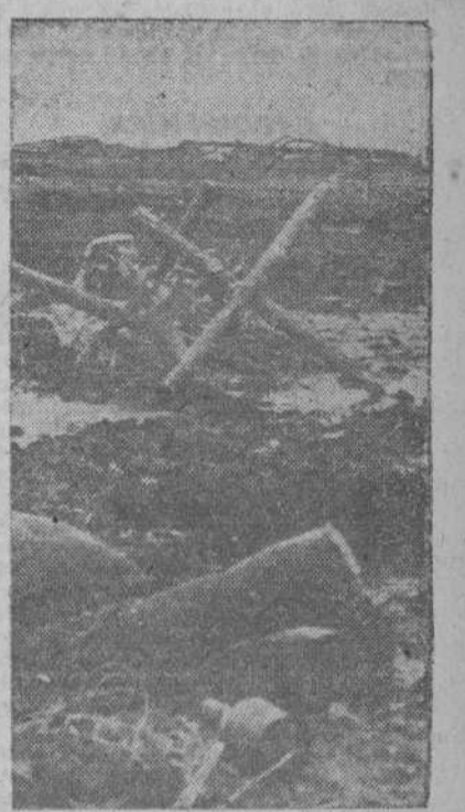
Con una granada en la mano, intentó acercarse este soldado bolchevique hasta las posiciones alemanas. Mas su misión de arrojar la granada contra los alemanes no pudo ser cumplida