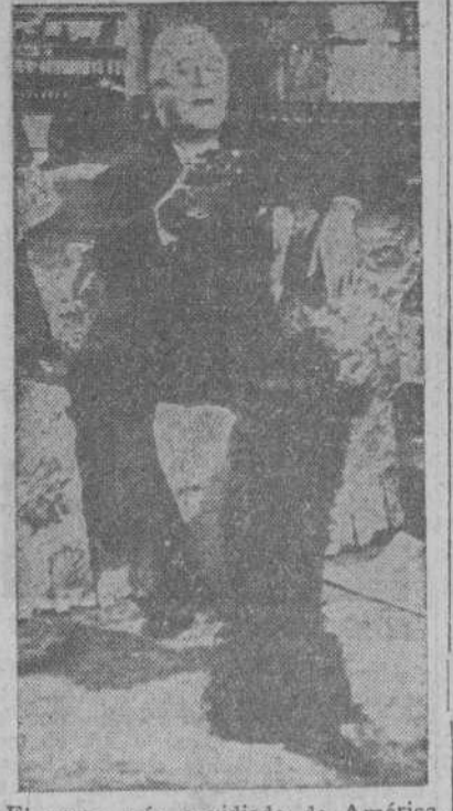
El perro más envidiado de América, recibiendo su comida de manos del Presidente Roosevelt