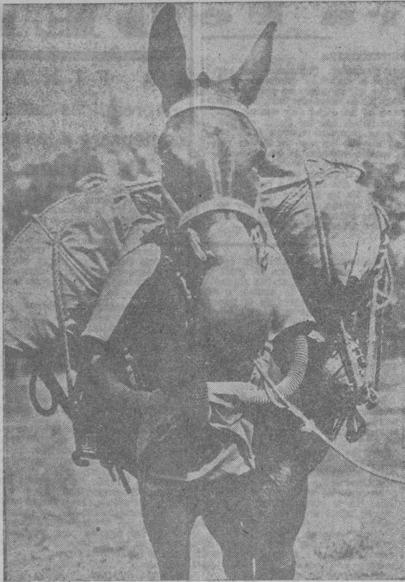
El Servicio de Guerra Química de Estados Unidos ha ideado una nueva careta de gases para los caballos y mulas, que proporciona el suficiente aire puro para que los animales puedan marchar al trote o al galope