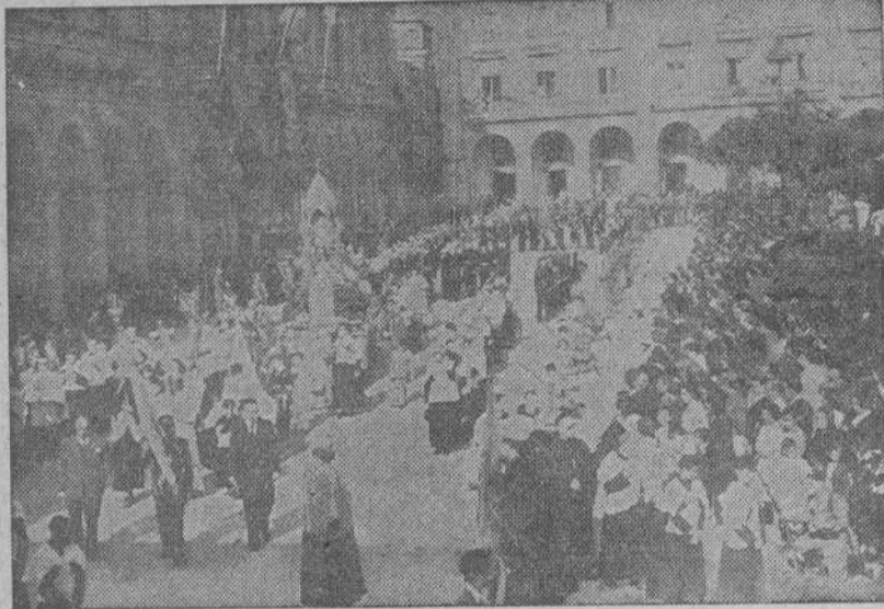
La solemne procesión desfila ante el Palacio Municipal

El artístico altar portátil de la Plaza de María Pita, fué instalado por el Ayuntamiento; el del Cantón