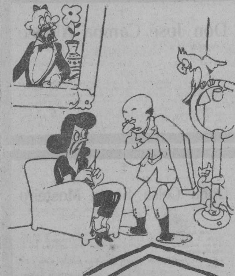
MUJERCITAS DE SU CASA, por Bellón —No te enfades esposa mía, pero sospecho que te has armado un lío al volverme el traje...

VICESECRETARIA DE ORDENACION ECONOMICA Se convoca a todos los fabricantes de harina de la provincia a una reunión que se celebrará hoy, viernes, día 25, a las cinco de la tarde, en el salón de actos de la Delegación Provincial de Sindicatos (Real 18-1.º).