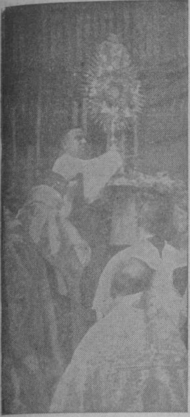
El M. I. Sr. Abad imparte la bendición con el Santísimo

La festividad del Santísimo Corpus Christi se celebró este año en La Coruña con el esplendor de los anteriores. La ciudad estuvo engalanada con colgaduras y en los edificios oficiales ondeó el pabellón nacional. Por la mañana, hubo numerosas comuniones en todas las iglesias, y se solemnizó la festividad del día en la E. e I. Colegiata con fiesta de primera clase. Desde por la mañana, en el referido templo permaneció el Santísimo expuesto a la adoración pública, siendo velado por turnos de la Adoración Nocturna, por los jóvenes de A. C. y por las Asociaciones Eucarísticas de la capital, así como por gran cantidad de fieles. La Adoración Nocturna tuvo vigilia solemne extraordinaria en San Jorge, durante la noche del miércoles al jueves.