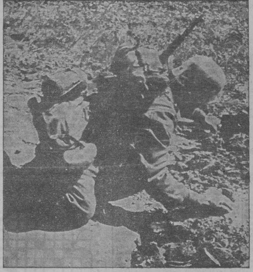
Las últimas unidades alemanas han abandonado la posición, y ahora son colocadas por los minadores las minas que entorpecerá el avance al enemigo