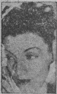
Conchita Montenegro creación de un cine nacional.

Es deliberado propósito del guionista huir de la española aunque no de lo español, y esta preocupación resta algo de naturalidad a la cinta, que por otra parte se desarrolla en un ágil ritmo.