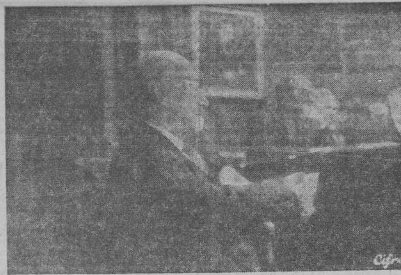
MADRID.—En el aula de Cultura, de la Vicesecretaría Nacional de Educación Popular, don Jacinto Benavente leyó el primer acto de su última comedia.