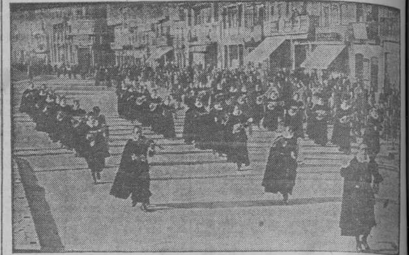
La Estudiantina Compostelana desfila por la Avenida de los Cantones a los acordes de un alegre pasodoble

Cumplimentó a las autoridades y dió dos conciertos en el Teatro Rosalía Castro