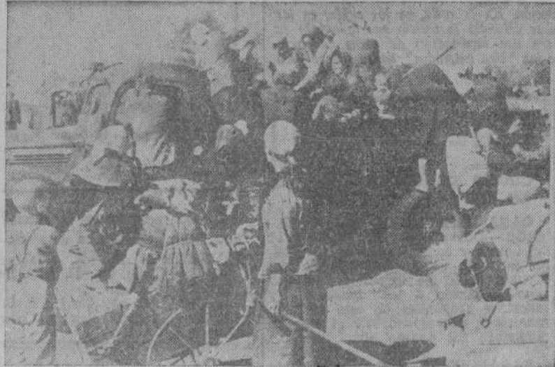
Familias ucranianas, protegidas por fuerzas de Policía alemanas, abandonan sus hogares y tierras ante el peligro de volver a caer bajo la férrea y bárbara dominación bolchevique.