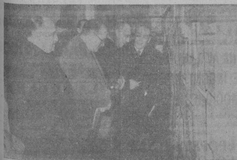
MADRID.—Con asistencia de los Ministros de Marina y Educación Nacional se ha inaugurado en el Museo Naval la Exposición del Concurso de Dibujos infantiles “Cara al mar”.