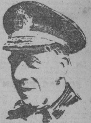
El Almirante don Salvador Moreno Fernández, Ministro de Marina

Para rendir honores acudió a la Estación una compañía del Regimiento de