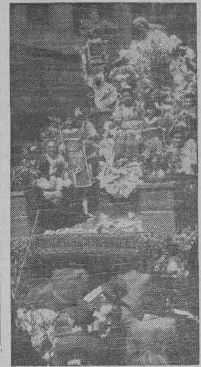
Con extraordinaria animación se han inaugurado en Murcia sus tradicionales fiestas de primavera. Un detalle del desfile de carrozas