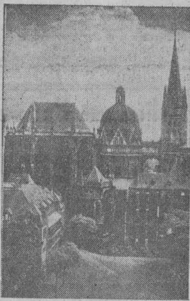
La Catedral de Aquisgran, joya arquitectónica en peligro de destrucción

CUARTEL GENERAL DEL CUERPO EXPEDICIONARIO ALIADO, 11.—La guarnición de Aquisgran no ha contestado al ultimátum cuyo plazo expiraba esta mañana. En consecuencia, ha sido reanudado el ataque a la ciudad.—(EFE).