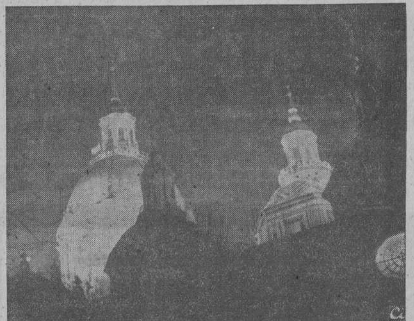
EL TEMPLO DEL PILAR

por Antonio González Velázquez y los nueve frescos de las bóvedas de las naves que rodean a la Santa Capilla, dedicadas a diversas advocaciones marianas, se deben a Francisco Bayeau y Francisco Goya.