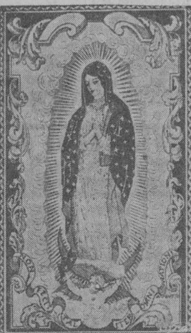
Nuestra Señora de Guadalupe, en la imagen que se venera en Méjico

Las fiestas jubilares durarán hasta el 12 de Octubre de 1945