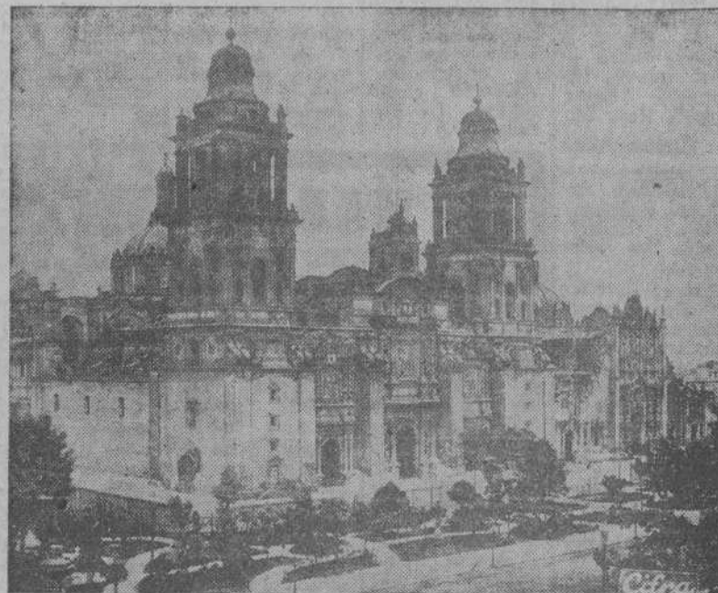
La Catedral de Méjico. En ella se encuentran los sepulcros de varios virreyes españoles y el del Emperador Agustín Iturbide, héroe de la independencia

¿Qué de sí no te arroja el Universo? Defendamos de estas injurias a los (CONTINUA EN CUARTA PLANA)