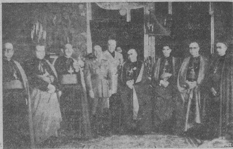
En el Palacio de El Pardo se ha celebrado la jura ante el Caudillo de los nuevos Obispos de León, Zamora, Oviedo, Teruel y Albarracín, Tuy y Arzobispo de Tarragona.—S. E. el Jefe del Estado, Generalísimo Franco, con el ministro de Justicia y los Prelados.