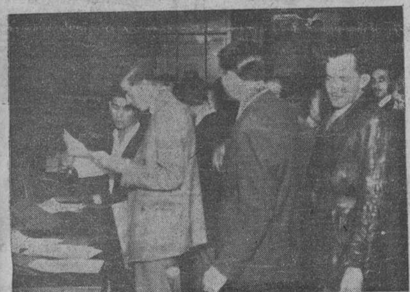
Es realmente extraordinaria la afluencia de productores que diariamente desfilan por la Delegación Provincial de Sindicatos de La Coruña. Nuestro fotógrafo ha captado un aspecto parcial de la animación que reina en dicho Centro.

Como se ve, todo está previsto, para que no quede nadie sin emitir su voto.