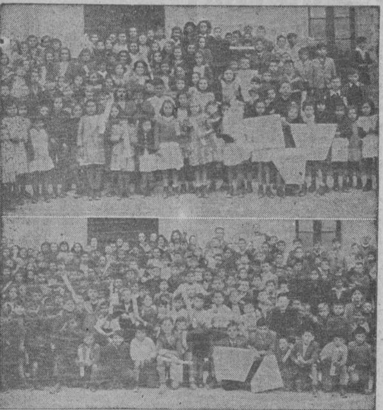
Niñas y niños de las Escuelas García Naveira, de Betanzos, que recibieron diplomas, premios en metálico y calzado, en un acto al que concurrieron las autoridades y jerarquías

Dr. J. Garrote. VIAS URINARIAS (Venéreo, riñón, vejiga y próstata). Consulta: Linares Rivas 35-2.º (Casa Barrié), de 5 a 7. SANATORIO, Unión 26. La Coruña