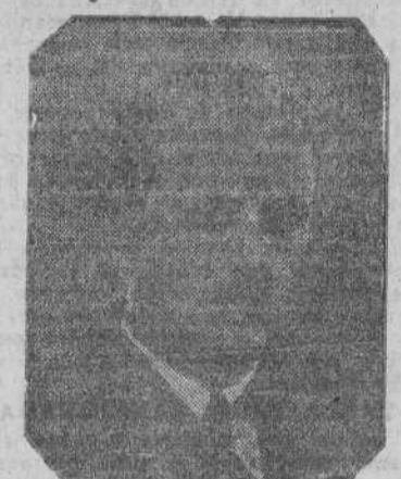
Don Raimundo Fernández Cuesta, presidente del Consejo de Estado