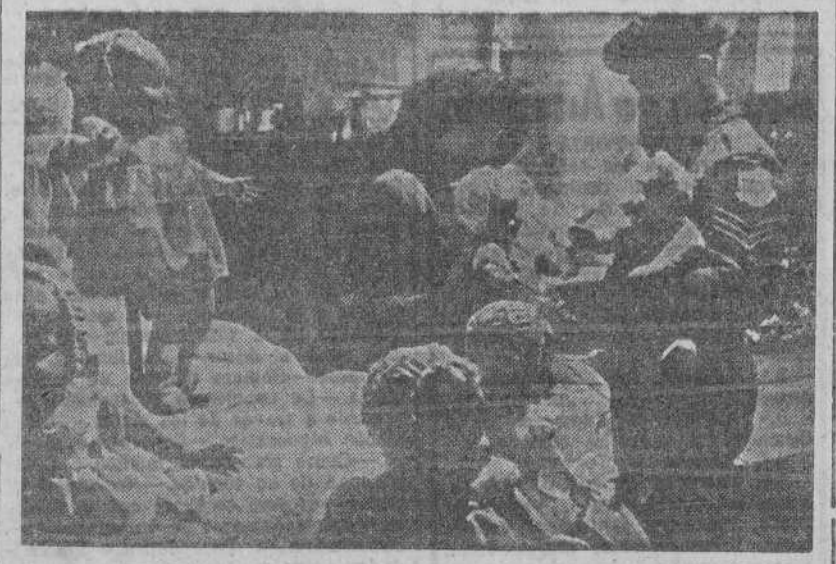
Un soldado inglés, con permiso, comprando juguetes para sus hijos en una tienda de Bruselas. He ahí una nota de ternura en medio del vendaval de la guerra. (Foto LOGOS).