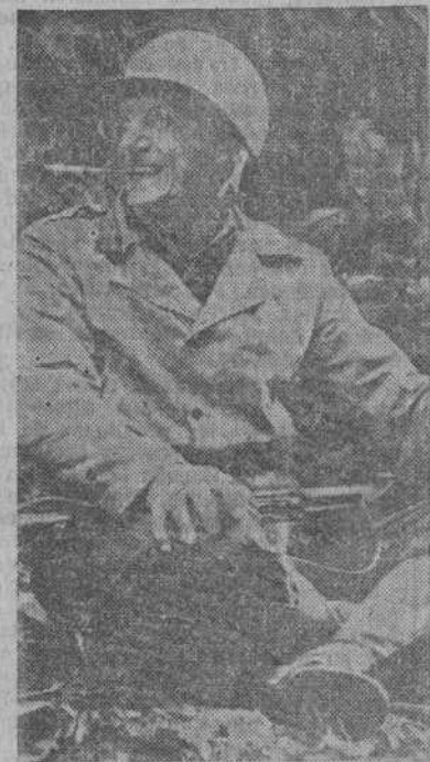
El general Stilwell que ha sido nombrado para sustituir al general Simón Bolívar muerto, en Okinawa.

Otra información oficial dice que los japoneses han tenido 90.000 muertos en la lucha por Okinawa.—(EFE).