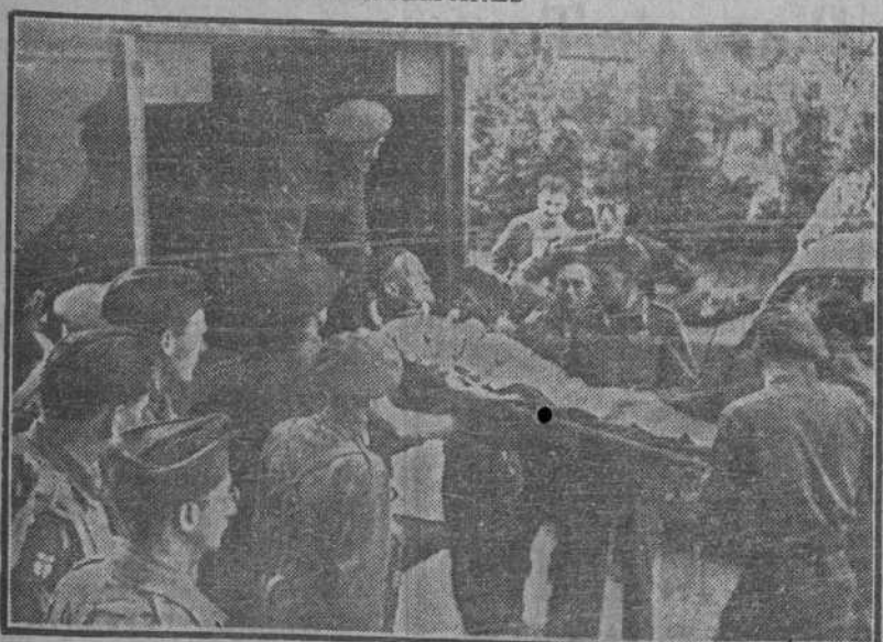
William Joyce, el locutor de radio inglés que trabajaba para los alemanes, es trasladado en una camilla a una ambulancia, para ser llevado a un hospital del II Ejército británico. Joyce —Lord "Haw Haw"—, fué herido en una pierna en el momento de su arresto.

EL LOCUTOR INGLES QUE ESTUVO AL SERVICIO DE LOS ALEMANES