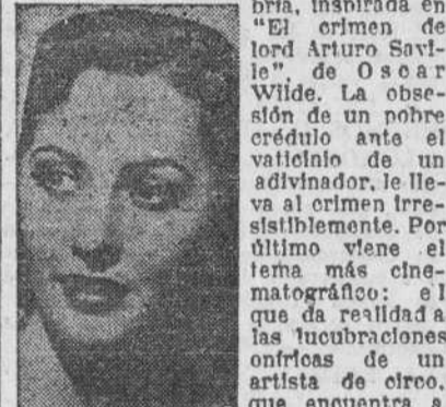
Barbara Stanwyck la mujer vista en sueños.

El tema inicial ha sido tomado de un argumento de Laslo Vadnay, y su realización es superior al resto de la película. Este primer relato es el más poético y tierno del magnífico film y el que más huella deja en el espectador sobre el que no resbala su exposición simplista. El prodigio de un rostro postizo sobre el corazón real, está hecho con mano maestra y bastaría esta realización para consagrar al director de "Garnet de balle". Sigue luego una pincelada pesimista y sombría, inspirada en "El crimen de lord Arturo Saville" de Oscar Wilde. La obsesión de un pobre crédulo ante el valcainio de un adivinador, le lleva al crimen irremisiblemente. Por último viene el tema más cinematográfico: el que da realidad a las lucubraciones oníricas de un artista de circo, que encuentra a