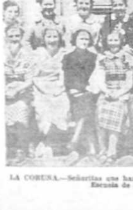
LA CORUÑA.—Señaladas que han terminado los estudios en la Escuela de Comercio