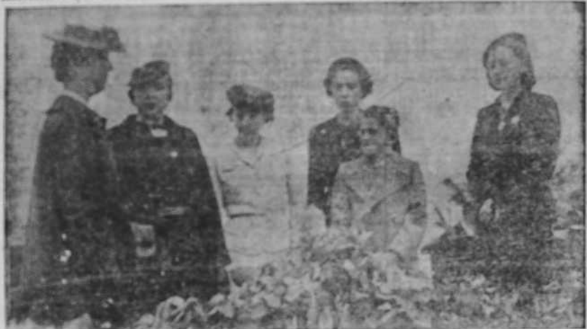
La esposa del Generalísimo y la viuda e hijos del general Mola, en el acto de la inauguración del monumento al glorioso general laureado.