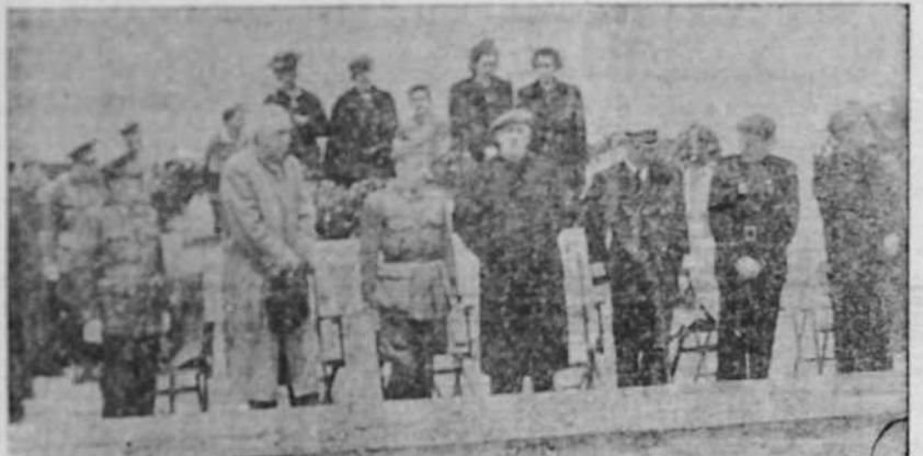
En Alacorte de Mola, con asistencia del Generalísimo se ha inaugurado el monumento al general Mola, en el mismo lugar en que halló la muerte hace dos años. En primer término el Generalísimo, durante la Misa; detrás, la esposa del Generalísimo y la viuda y familiares del general Mola.