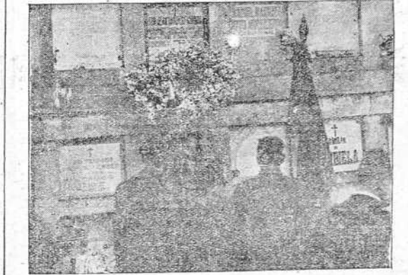
Momento de ser colocada una corona en el nicho donde reposan los restos del glorioso comandante Barja de Quiroga. INFORMACION EN TERCERA PLANA.