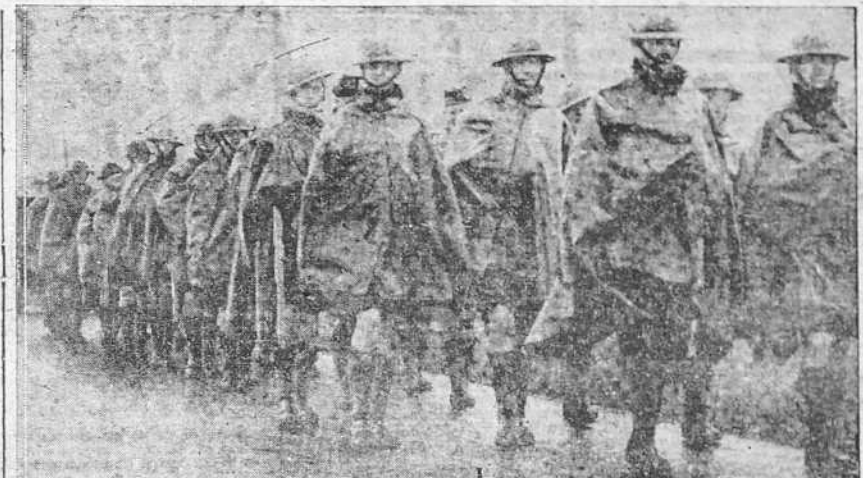
Los primeros contingentes ingleses han llegado a tierra francesa e inmediatamente han sido conducidos al frente