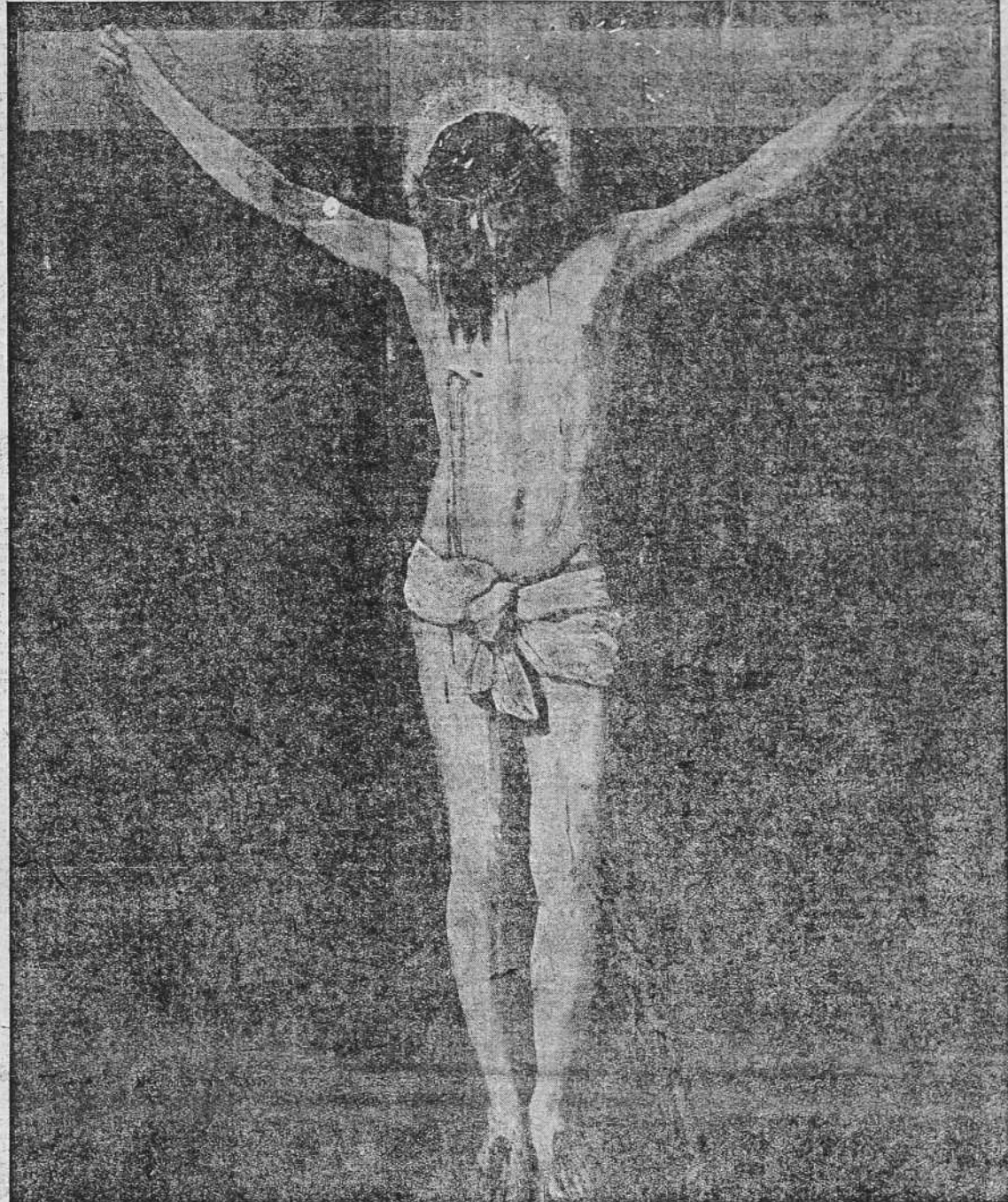
POR VUESTRA PASION SAGRADA; POR VUESTRA MUERTE EN LA CRUZ; POR LOS DOLORES DE VUESTRA SANTISIMA MADRE: SEÑOR, DAD LA PAZ AL MUNDO.