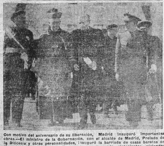
Con motivo del aniversario de su liberación, Madrid inauguró importantes obras.—El ministro de la Gobernación, con el alcalde de Madrid, Prelado de la Diócesis y otras personalidades, inauguró la barriada de casas baratas de la colonia municipal de Users, que comprende setecientas viviendas.