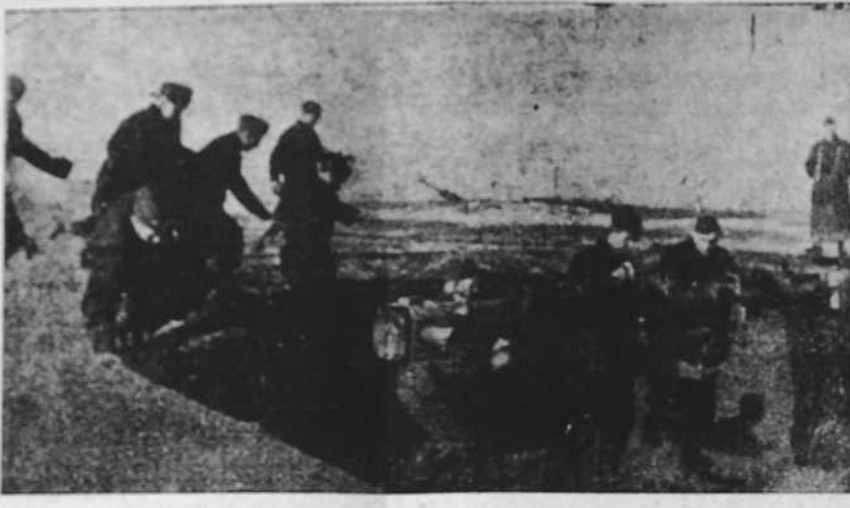
A lo largo de la costa alemana del Mar del Norte se suceden los emplazamientos de baterías antiaéreas que actúan con una eficacia bien probada contra las incursiones de la aviación inglesa.