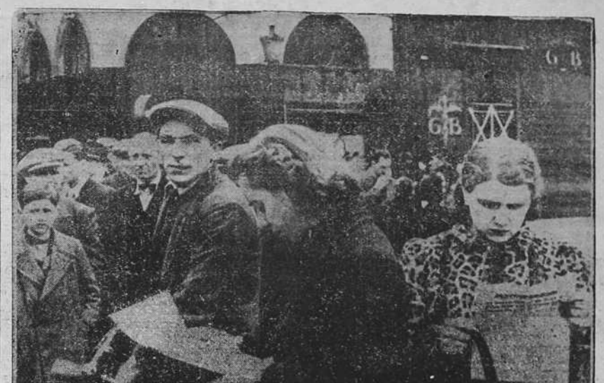
LIEJA.—Los servicios de propaganda del ejército de ocupación alemán distribuyen entre la población civil impresos, en los que se especifican las razones que han motivado la ocupación de Bélgica por el ejército del Reich. (Foto CIFRA).

El jefe del Estado Mayor de las "camisas negras" ha publicado una lista de voluntarios en la que subraya el deseo que late en todos los corazones italianos. Termina con los gritos de guerra "¡Saludemos a los ejércitos y a las banderas!"—(EFE).