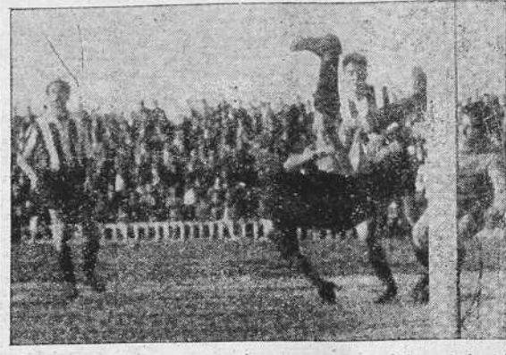
En uno de los muchos momentos de apuro por que pasó la portería del F. C. Barcelona, un medio catalán tuvo que realizar esta acrobacia para sacar, en extremis, un balón que estaba a dos centímetros de la meta barcelonesa.