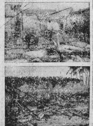
Lo que quedó del garage incendiado en la madrugada pasada. (Información en segunda plana).

bién las columnas enemigas en marcha, los transportes militares, las concentraciones de tropas y las batallas de artillería. Además fueron atacados y destruidos en parte varios puentes sobre el curso inferior del Marne, lo que constituirá un importante obstáculo para la retirada enemiga.