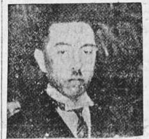
EL PRINCIPE KONOYE

no presidido por el príncipe Konoye, jefe del movimiento nacional japonés.—(EFE).