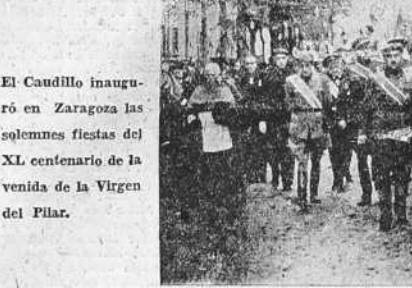
El Caudillo inauguró en Zaragoza las solemnes fiestas del XL centenario de la venida de la Virgen del Pilar.