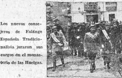
Los nuevos consejeros de Falange Española Tradicionalista juraron sus cargos en el monasterio de las Huelgas.