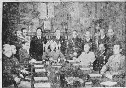
El 10 de agosto de 1939 quedó constituido el nuevo Gobierno, que celebró pocos días después su primera reunión, bajo la presidencia del Jefe del Estado.