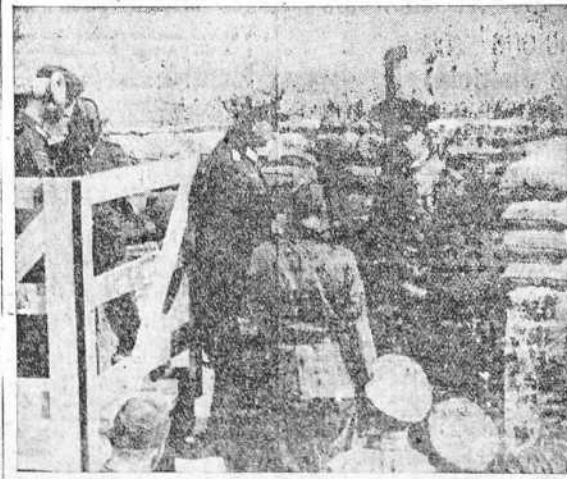
El almirante Raeder visita las posiciones de artillería en la costa, que están listas para participar en la lucha a muerte contra Inglaterra.