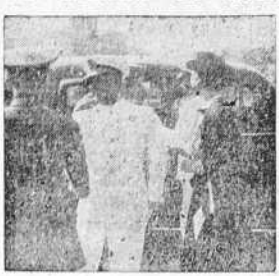
El Jefe del Estado, acompañado de su esposa, saluda a las autoridades al llegar al Club Náutico