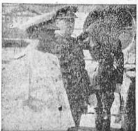
S. E. el Jefe del Estado, acompañado del gobernador civil, a su llegada al Real Club Náutico