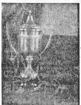
La magnífica Copa donada por el Generalísimo para las regatas de Andurinas