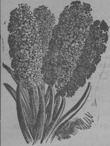
Jacintos dobles de Holanda JOSÉ BLANCO VEGA :- Plaza del Hierro, núm. 1 (soportales)

BULBOS, RIZOMAS, TUBÉRCULOS, CEBOL- LLAS DE FLORES Y SEMILLAS