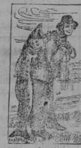
Marca de fábrica.

Deben tomar una medicina alimento que les permita recobrar con rapidéz las carnes, las fuerzas y la salud perdidas. Esta medicina-alimento es la famosa