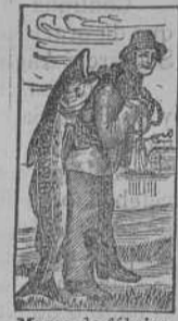
Marca de fábrica.