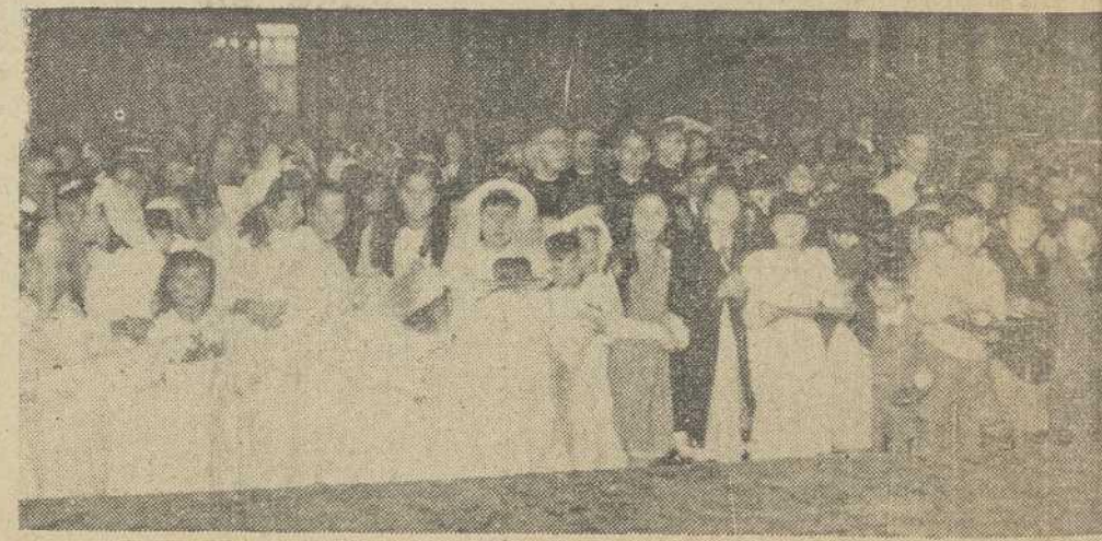
La procesión infantil pro Seminario en Santiago fué, como en años anteriores del creciente entusiasmo de mae stros y niños por el Seminario Diocesano El grabado reproduce el momento en que, ya en la iglesia de S. Martín, los chicos de cada escuela se disponen a entregar las ofrendas de que son portadores

"Tradic... Da principio a la tema, haciendo retiro "moderno" q... tres meses viene c... San Sebastián. Re... vaciado en moldes... vez al mes se reu... las señoras y sus... discutir la ponencia... una anterior reuni... ¿Por qué unidos... posas? ¿Cuántas v... ción de los hijos... falta de uniformid... en los esposos! U... más, es el quien se... la educación. Alg... bien se den casos... no siente el criter... que deseé para sus... cación "a la antigü... conveniencia de la... bos. Haría, pues, modernizar la "Sem... dre", celebrándola e... unidos los esposos.