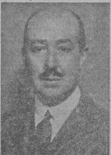
D. Alfonso Fisicovich y Gullón, que ha sido nombrado Ministro plenipotenciario de España en Ankara.

Mr. Byrnes está instalado en el hotel "Maurice". En este hotel reina una actividad inusitada, con ecos en el