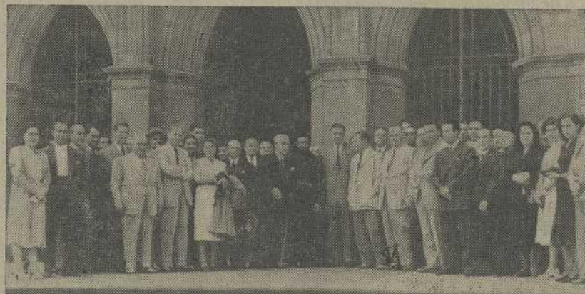
Jerarquías, autoridades y afiliados al Sindicato después de la misa