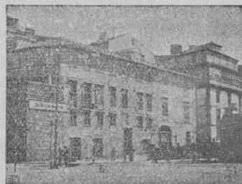
Casa de LA VOZ DE GALICIA

Posee la gran Cruz de Isabel la Católica, cuyas insignias le regalaron las Cámaras de Comercio y Asociaciones de Navieros y otras de Coruña y Vigo.