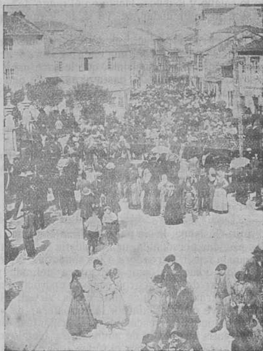
Pontevedra.—Fiesta de la Virgen del Camino

Abierto al progreso, conocedor de las necesidades del país, rodeado su nombre de aureolas de popularidad y acompañado de una estimación sincera y de un respeto justo, el Sr. Gasset es por quinta vez ministro, pero sin ambiciones, porque con sus otras cualidades brilló siempre en él una verdadera modestia.