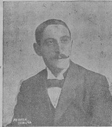
Excmo. Sr. D. Rafael Gasset Chinchilla Ministro de Fomento