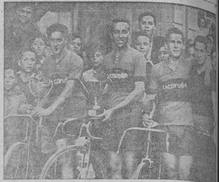
Equipo ciclista de Educación y Descanso de La Coruña, que, en Santiago conquistó los tres primeros puestos en la carrera de fondo, celebrada en motivo de las fiestas del Apóstol