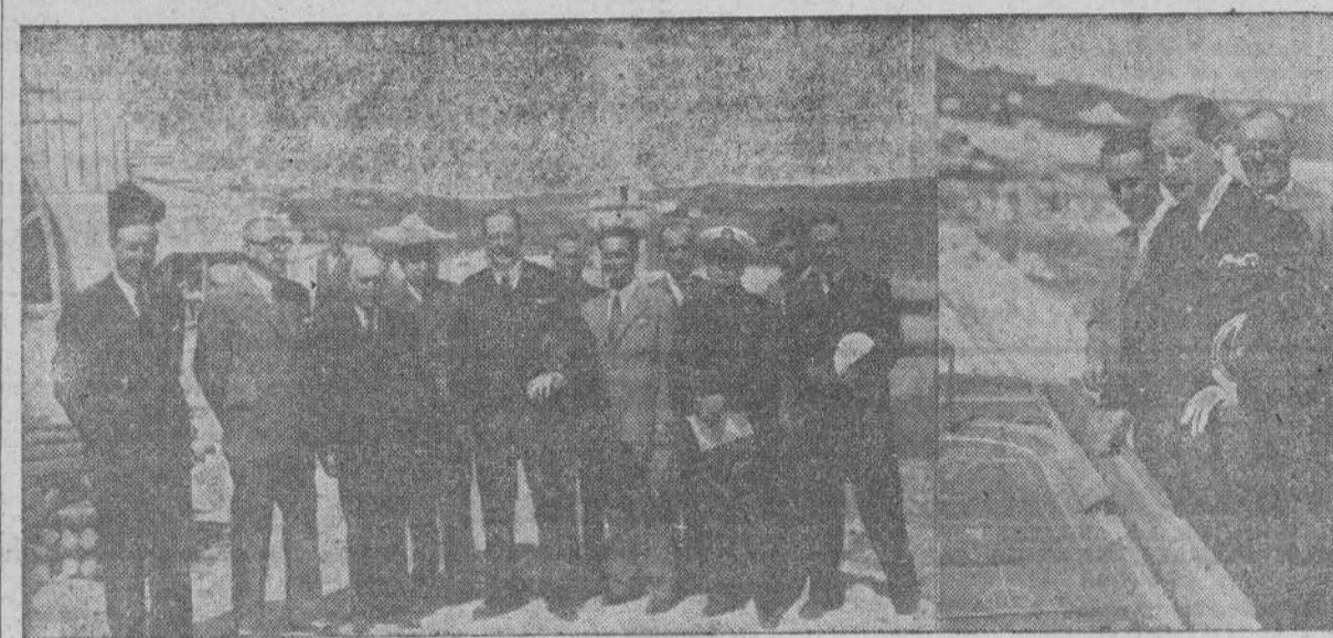
El Director General de Aduanas hizo ayer una visita a las obras del Estadio municipal cuyo proyecto elogió grandemente