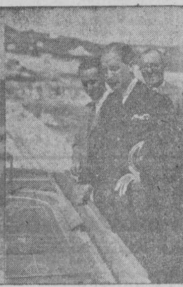
El Director General de Aduanas hizo ayer una visita a las obras del Estadio municipal cuyo proyecto elogió grandemente

VALLADOLID, 21. — La Falange de Valladolid conmemorará mañana el sexto aniversario de la gesta heroica del Alto de los Leones de Castilla. Las autoridades, jerarquías y numerosos camaradas, se trasladarán al histórico lugar para rezar un rosario y un responso ante la Cruz de los Caídos que perpetúa el heroísmo de los camaradas de Castilla que defendieron aquella posición.—(CIFRA).