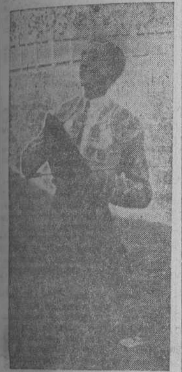
Manolite salutando al Caudillo

Lleno casi completo en los tendidos y claros en las localidades altas. La presencia del Caudillo, su esposa y su hija, es saludada con una cariñosa ovación por el público, y la banda interpretó el himno nacional, que fué escuchado con entusiasmo.