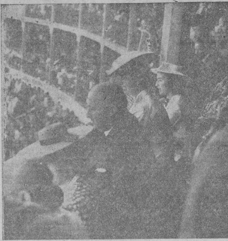
S. E. el Jefe del Estado, con su esposa y su hija, presenciando la corrida de toros celebrada el lunes en el coso coruñés

Pepe Bienvenida tuvo una buena actuación. Sacó de su primero el mejor partido posible, pero muy poco pudo hacer con el cuarto de la tarde, que le había llegado blando y soso al último tercio, impidiéndole realizar una fa-