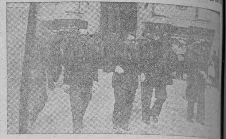
Las autoridades corufesas a la salida del templo de San Nicolás donde celebró la tradicional función del Voto