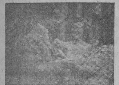
Dos bellas señoritas postulando a beneficio de la Cruz Roja

Organizada por la Asamblea local de la Cruz Roja, y a beneficio de esta institución, se celebró ayer en La Coruña la denominada fiesta de la banderita. En diversos lugares de la capital fueron instaladas artísticas mesas de petitorio