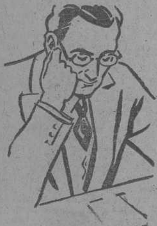
Censura Sanitaria n.º 26

Servicio semanal de mercancías y encargos Avisos: Feijóo, 11 — Teléf. 1140