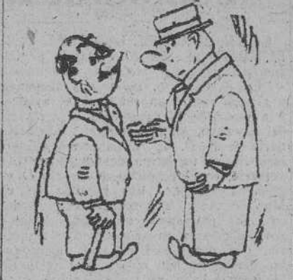
VERAÑO, por GALINDO

—No sé si irme unos días a San Sebastián o quedarme aquí con mi mujer. —Duda usted entre la costa y la costilla.