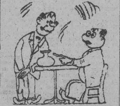
EN EL CAFE, por GALINDO

—No sé si irme unos días a San Sebastián o quedarme aquí con mi mujer. —Duda usted entre la costa y la costilla.