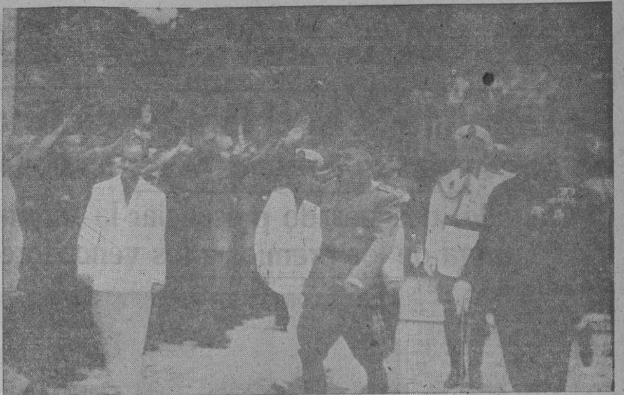
El Caudillo pasa revista a los voluntarios y ex-combatientes alineados en los Jardines de Méndez Núñez

APRENDA CONTABILIDAD POR CORRESPONDENCIA por un coste módico, utilizando sus ratos libres, se hará rápidamente tenedor de libros y conseguirá un empleo bien retribuido. Centenares de alumnos satisfechos prueban la excelencia de nuestro método único. Pida folleto, condiciones y detalles gratis. ACADEMIA C.C.C. Centenario. 6. SAN SEBASTIAN