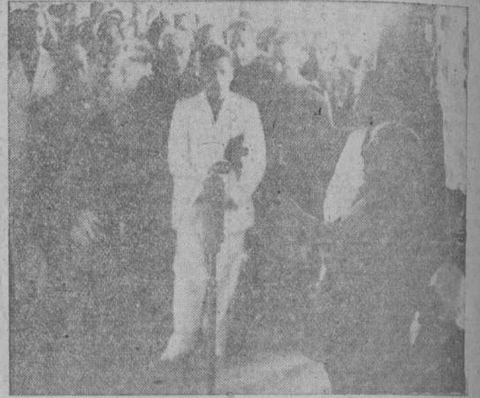
EL CAUDILLO DURANTE EL DISCURSO QUE PRONUNCIÓ EN LA CASA DE LA FALANGE CORUÑESA