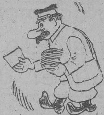
EN RUSIA, por GALINDO —Esta carta debe ser para Stalin porque le han quitado el Don!