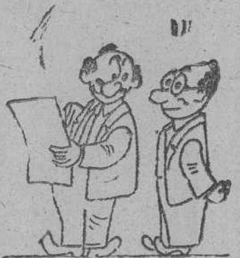
GEOGRAFIA, por GALINDO —Esta muy bonito este mapa de Rusia que ha hecho usted pero la parte del Cáucaso está un poco sucia... tiene manchas... —Si, de petróleo...