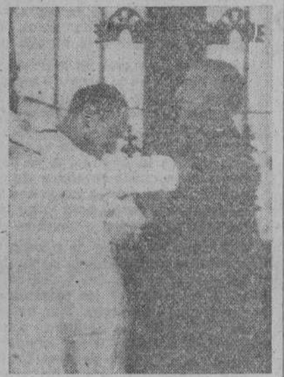
El Ministro Secretario del Partido prende en el pecho del Jefe nacional del Movimiento la insignia de la Falange

che, el público no cesó ni un solo instante de aclamar al Caudillo, y los gritos de ¡Franco! ¡Franco! ¡Franco! atronaban el espacio. Pocas veces recordamos una exteriorización del sentimiento popular expresado con tanto entusiasmo como ayer. Las aclamaciones eran continuas y sin interrupción cuando el Caudillo penetró en la Casa de la Falange.