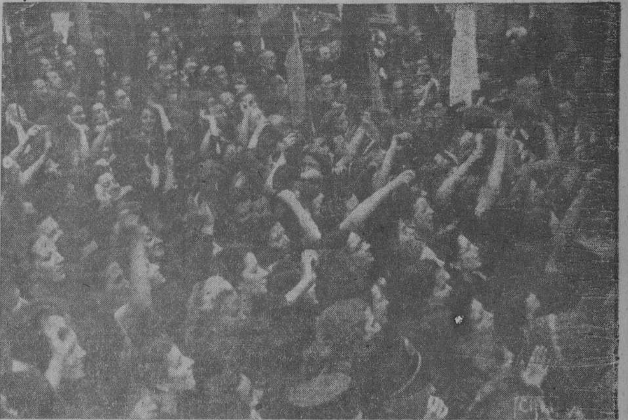
Santiago, Pontevedra, Vigo, Lugo, La Coruña y todos los pueblos de Galicia vibraron de entusiasmo frenético ante la presencia y el verbo del Caudillo. La región entera ha dado un alto ejemplo de adhesión y entrañable cariño hacia el más preclaro de sus hijos: FRANCO. Buenas lecciones de patriotismo de las que podemos sentirnos orgullosos. En prodigioso alarde de solidaridad, multitudes inmensas vitorearon a España y aclamaron al Caudillo. La "foto" recoge uno de los momentos de exaltación popular vividos por los gallegos.