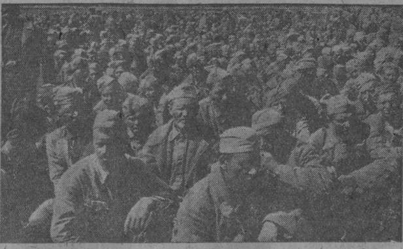
Un campo de concentración de prisioneros bolcheviques en la curva del Don. En la fotografía se pueden ver algunos soldados de mayor edad, prueba de que los soviets ya no disponen de bastantes jóvenes para la lucha.