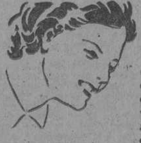
Censura Santarín a. 2

conviene Jarabe Salud. Su acción vitalizadora contribuye a efectuar un alumbramiento feliz y en la crianza ayuda a la madre a evitar los peligros de la debilidad y la desnutrición, permitiéndola criar a su hijo sano y robusto