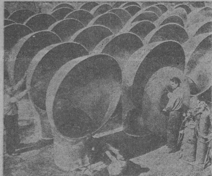
Las caperuzas de ventilador son tan importantes para un barco como la hélice. Una fábrica que hace meses no soñaba en dedicarse a construcciones navales, las produce ahora a cientos. En caso necesario, esas caperuzas, pueden ser utilizadas como altavoces para denunciar la presencia de submarinos enemigos.