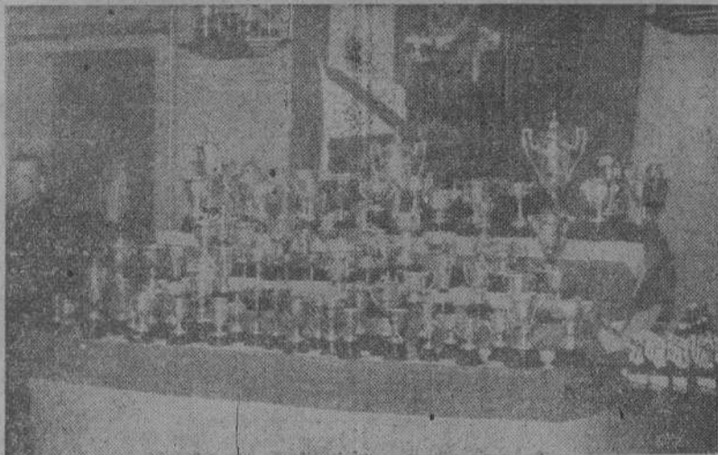
Trofeos que fueron repartidos, ayer, en el Real Club Náutico.

Ayer se verificó en el Real Club Náutico la entrega de trofeos a todos los ganadores de las pruebas celebradas en el año actual. Estas han sido, como se recordará, importantísimas, entre las que hay que destacar la Copa del Generalísimo, siendo La Coruña la única ciudad donde se disputó tal trofeo. Con este motivo conviene recordar que numerosos clubs de España han solicitado tomar parte en dicha competición, y para ello piden que se sustituya el tipo de "Andurina" por balonero de la serie "Snipe".