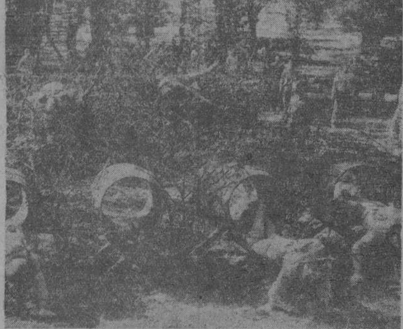
Los soldados de Infantería de Marina americanos, de servicio en la Embajada de su país en Londres, realizan ejercicios de combate. Al parecer, el entrenamiento resulta bastante divertido.