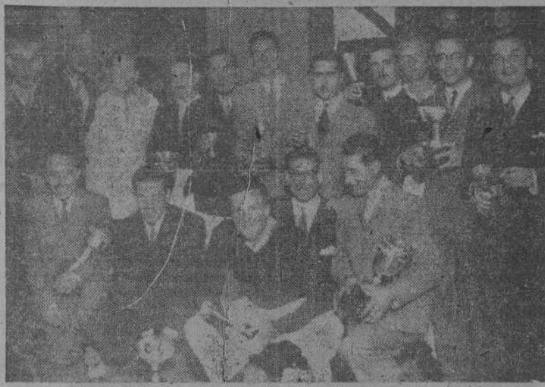
Los balonistas vencedores en las últimas regatas de "Andurina".