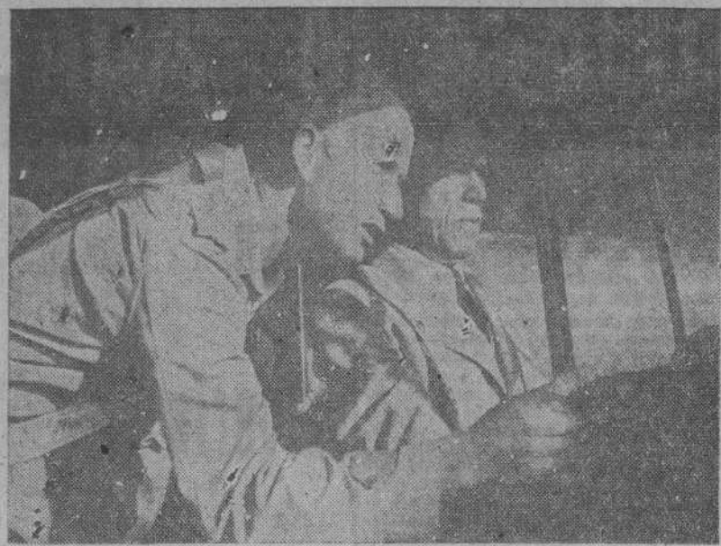
Para mantenerse a la altura de sus subordinados, el subsecretario de Guerra de Estados Unidos, Sr. Robert P. Patterson (a la derecha) está aprendiendo a volar. Ha sido fotografiado con su instructor, antes de elevarse en un aeroplano de Washington para efectuar su primer vuelo solo.

En Stalingrado, continúa la progresión alemana. Una compañía de zapadores ha conseguido, bajo un bombardeo artillero que duró 36 horas, desenterrar e inutilizar más de 1.504 minas bolcheviques sembradas en un terreno de varios centenares de metros de largo. La aviación ha concentrado sus ataques contra las posiciones de resistencia y fortines anti-aéreos al silencio. Aparatos de combate y destrucción hostigaron al enemigo en su ataque a la posición alemana al Norte de Stalingrado. En combates aéreos fueron derribados 19 aparatos soviéticos, mientras que otros seis eran destruidos por la DCA. Seis aviones alemanes no han regresado a sus bases. (EFE)