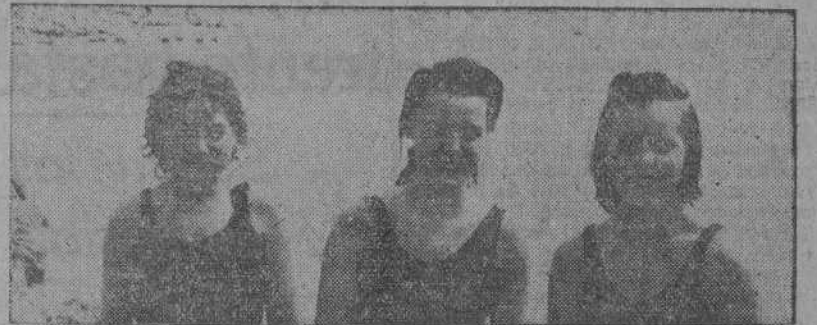
Las tres nadadoras que se clasificaron en los campeonatos sociales, celebrados por el Club del Mar