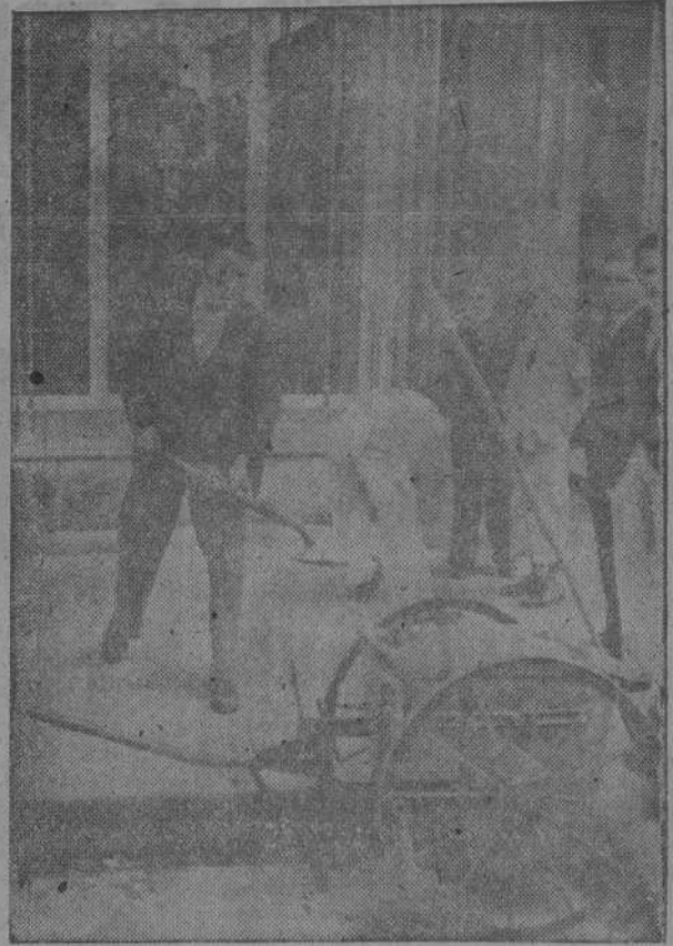
Obreros municipales estuvieron dedicados durante las últimas horas de la mañana y primeras de la tarde, a la recogida de los cristales que cayeron a la vía pública

(Continuación de primera página) El polvorín siniestrado, era un pequeño edificio de planta baja, con paredes de piedra, y tenía varios sótanos en los que se guardaba solo pólvora negra.