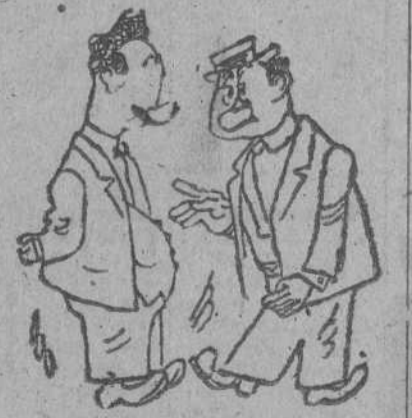
NOVOROSISK, por GALINDO —Yo no se si los alemanes tiraban bien al blanco, pero lo que no cabe duda, es que tiran bien al Negro.

En consecuencia, el enemigo ha sufrido uno de los desastres más graves de los que han sido infligidos hasta ahora en operaciones contra convoyes. En seis días, el enemigo ha perdido 38 barcos mercantes, cargados de materiales de guerra de todas clases, representando un total de 370.000 toneladas. A esta pérdida hay que añadir la de seis buques de guerra. Únicamente algunos restos del convoy, parte de los gravemente averiados han podido huir."—(EFE.)