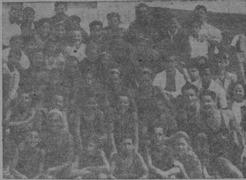
Participantes en las distintas pruebas de natación celebradas en San Amaro, por el Club del Mar