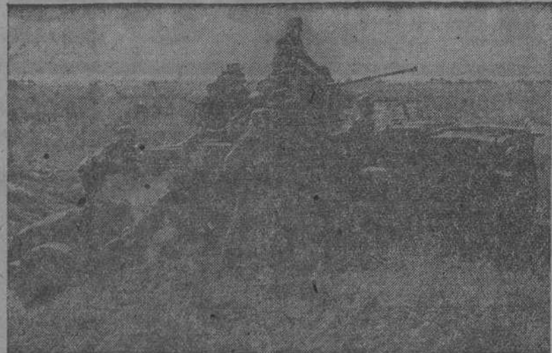
Un antiavión motorizado alemán avanza hacia Stalingrado, la poderosa ciudad rusa en la que se combate con sin igual dureza